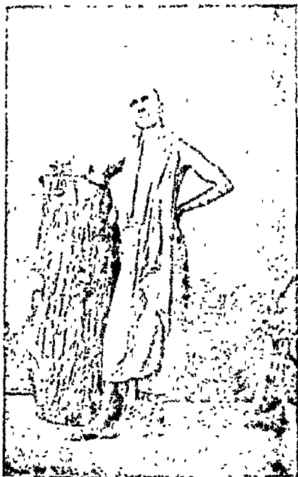
SHRI SWAMI RAM TIRTHA.